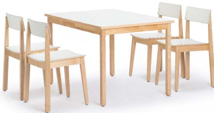
S200 suorakaidepöytä ja 4 kpl O100P pinottava Onni-tuoli

Pöydän kansi kalustelevyä pinnoitettuna korkeapainelaminaatilla tai ääntä vaimentavalla Acoustic-pinnoitteella. Kannen paksuus noin 25 mm. Värit perusvärimallistosta. Reunat listoitettu koivun värisellä ABS-reunanauhalla. Jalat ja sarjat lakattua massiivikoivua. Jaloissa ruuvikiinnitteiset liukuestenastat vakiona. Pöydän korkeudet 630 ja 730 mm.